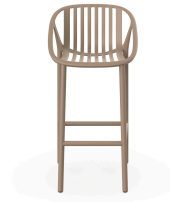
Sand Bini High Stool 06543