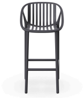
Dark Grey Bini High Stool 06538