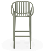
Greenish Grey Bini High Stool 06539