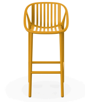
Tuscan Bini High Stool 06542