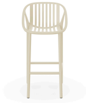
Stool Ivory Bini High Stool 06540