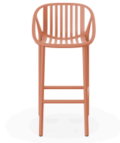
Terracotta Bini High Stool 06541